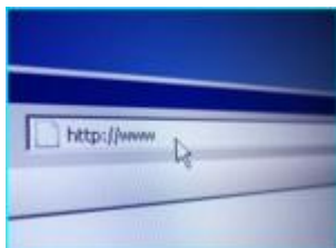
im Internet surfen