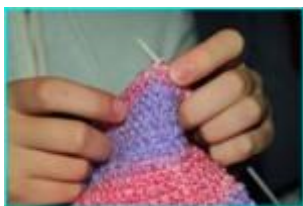
stricken robić na drutach