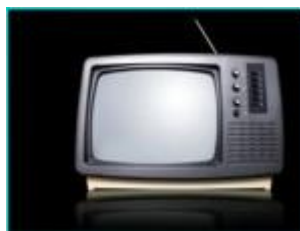
fernsehen oglądać telewizję