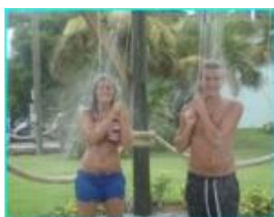
duschen brać prysznic