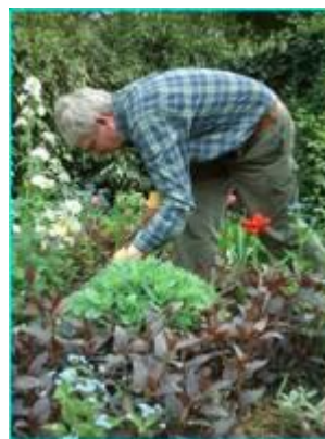
im Garten arbeiten pracaować w ogrodzie