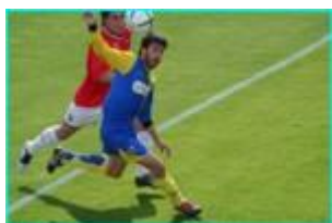
Fußball spielen grać w piłkę nożną